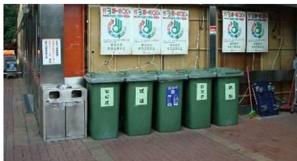
資源回收設施設置區域