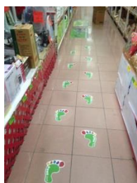
使用地貼引導至綠色商品處