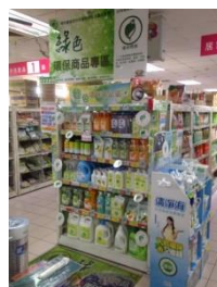
使用標誌牌標示綠色商品處