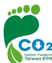
碳足跡減量標籤 (減碳標籤)