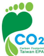
碳足跡標籤 (碳標籤)