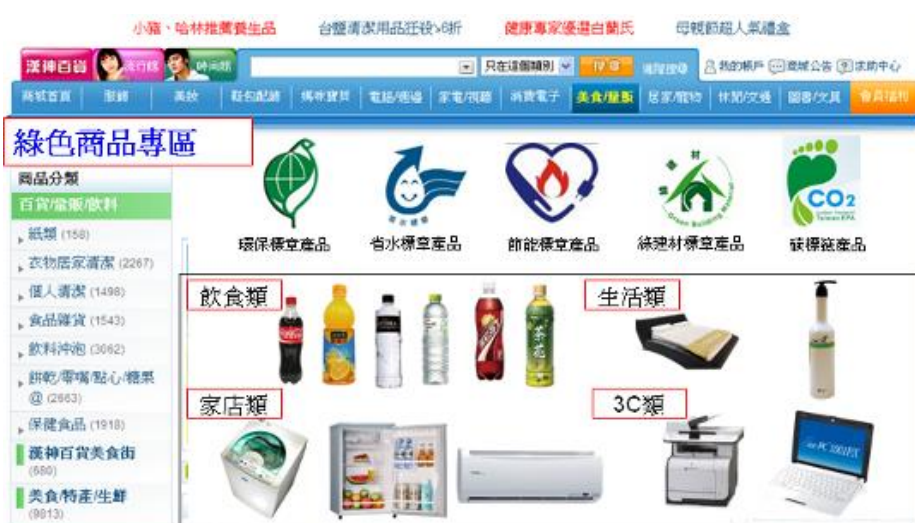
網路採購綠色商品專區示意圖